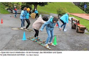
«Spiel dich durch Adelboden» ist ein Konzept, das Adelboden und Spiez für jede Altersstufe verbindet.

Das neue Angebot soll nicht nur den Spielenden, sondern auch den Besuchern eine tolle Zeit bescheren. Es ist ein Ort, an dem man sich entspannen kann und dabei auch noch etwas lernen kann. Die Spielposten sind am Freitag in Langnau und Burgdorf. Dort kann man sich an mehr als 20 Stationen auf dem Weg durchs Dorf machen.