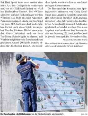
Der Spielposten «Schlittschuhlaufen» bei der Technischen Kantine wird montiert. (S.10/20)

26 Spielposten für Adelboden erfinden. Witzige Namen sollen zum Spass anregen. Mit «Spass und Abenteuer ohne Koffein» wird zur Kaffeestube eingeladen. Vor der Kaffeestube wird ein Kaffeebohnen-Jagd ausgerollt und muss mit einer Taufe abgeschlossen werden. «Velo-Roulette» wird vom Bike-Shop geplant.