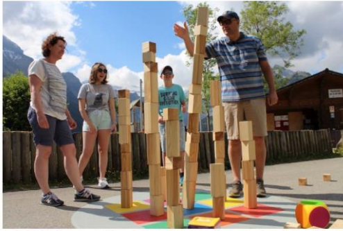
Verschiedene Aufgaben warten auf dich: Wanderschuhe im Duell schärfen, Alpentiere stapeln, einen lustigen Wettkampf auf Skiern, beim Golf und Tennis bestreiten oder spielerisch Murmeltiere fangen.

Am 20. Juni fällt der Startschuss für ein neues Freizeitangebot in Adelboden. Quer durchs Dorf laden über 20 Posten zum Spielen und Verweilen ein. Dabei nehmen die Spiele thematischen Bezug zu den Geschäften oder zur Umgebung.