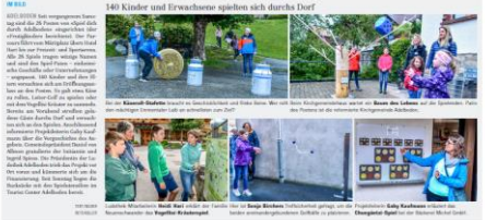
140 Kinder und Erwachsene spielen sich durchs Dorf. (S.10/20)

«Spass und Abenteuer ohne Koffein» wird zur Kaffeestube eingeladen. Vor der Kaffeestube wird ein Kaffeebohnen-Jagd ausgerollt und muss mit einer Taufe abgeschlossen werden. «Velo-Roulette» wird vom Bike-Shop geplant.