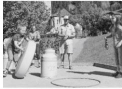
Käserrollen der Käse