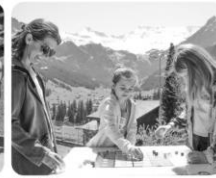
Spiel im Aussicht